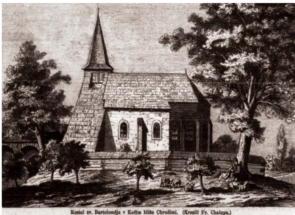
Kostel sv. Bartoloměje v Kočím blízko Chrudimi.

Dalším příjemným zastavením je obec KOČÍ a především zdejší římskokatolický kostel svatého Bartoloměje . Nechala jej postavit druhá manželka Václava IV. Žofie Bavorská zakládací listinou v roce 1397 jako filiální kostel k hlavnímu chrámu Nanebevzetí Panny Marie v Chrudimi.